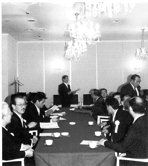
(全国の損害保険代理業協同組合役員との懇談風景)