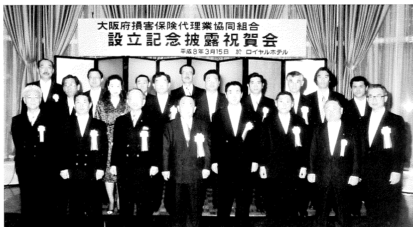
(全組合員による記念写真)