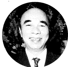
横山ノック氏 (大阪府知事)