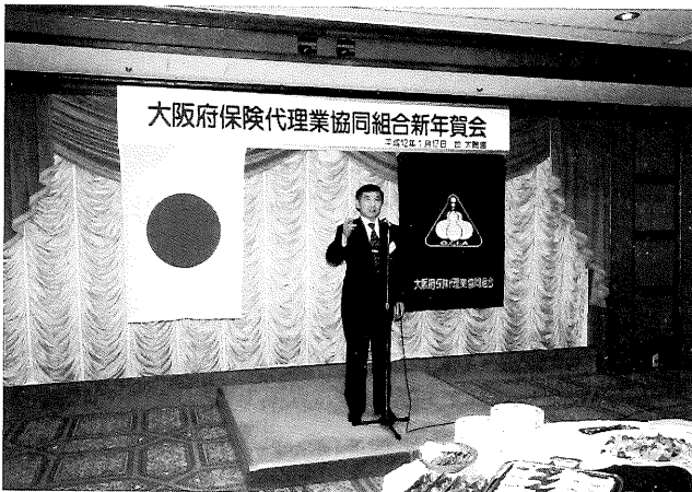
(平成12年1月17日開催の新年賀会風景)