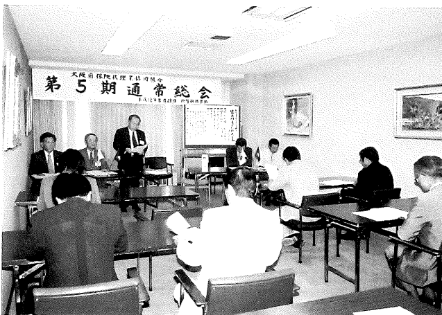
(第五期通常総会の会場風景)