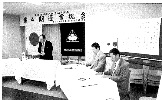
(第4期通常総会の会場風景)