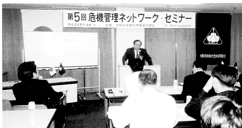
(第5回危機管理ネットワーク・セミナーの風景)

以上、事業委員会による活動をはじめ、研修・研究委員会の充実した企画の実施、総務委員会による互例会、親睦会、そして危機管理ネットワーク事業の推進、そして保険代理業経営懇談会の定期的(毎月)開催等々、全組合員の活動により無事に各事業が推進されたことを申し述べ、第5期の事業報告とさせていただきます。